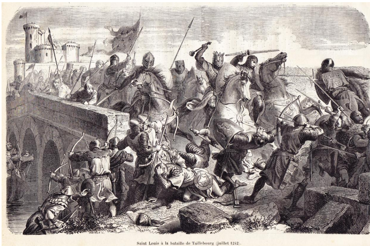
Saint Louis à la bataille de Taillebourg (juillet 1212).